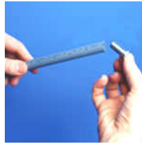
Comprobar que no hay rebabas y colocar el casquillo en el tubo.