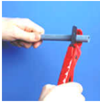
Cortar el tubo con tijera

Presión y temperatura de trabajo: 20° C: 12 Atm. 90° C: 6 Atm.