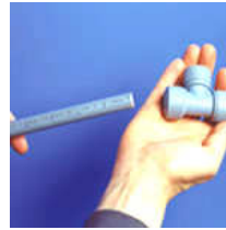
Insertar el tubo en la pieza. Girar un poco y presionar hasta el fondo. Para finalizar, pegar un fuerte tirón del tubo.