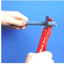
Cortar el tubo con tijera

Presión y temperatura de trabajo: 20° C: 12 Atm. 90° C: 6 Atm.