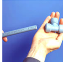
Insertar el tubo en la pieza. Girar un poco y presionar hasta el fondo. Para finalizar, pegar un fuerte tirón del tubo.