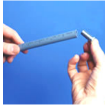
Comprobar que no hay rebabas y colocar el casquillo en el tubo.